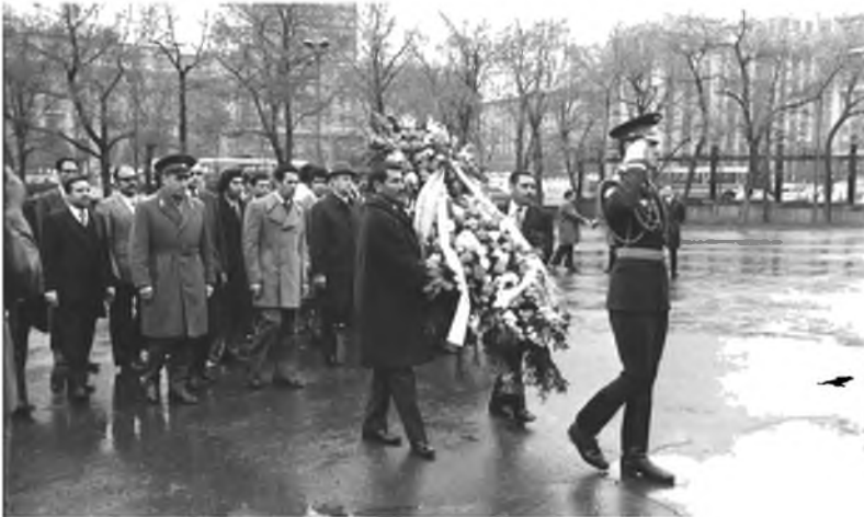
رئيس الوزراء الليبي الأسبق عبد السلام جلود في موكب لوضع إكليل من الزهور على قبر الجندي المجهول أثناء زيارته لموسكو، 15 / 5 / 1974.